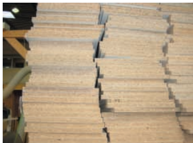
Figure 8 – Panneaux de particules mélaminés

Le procédé de fabrication est le suivant :