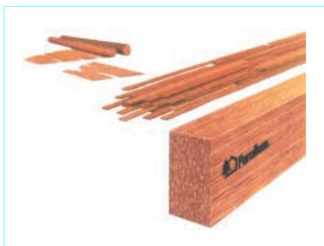
Figure 6 – Le Parallam® PSL : dérivé de bois déroulé découpé en lamelles longues (ou PSL : Parallel Strand Lumber ) (source : Trus Joist™)

Le fabricant américain Trus Joist™ propose ce produit sous l'appellation Parallam® PSL (figure 6).