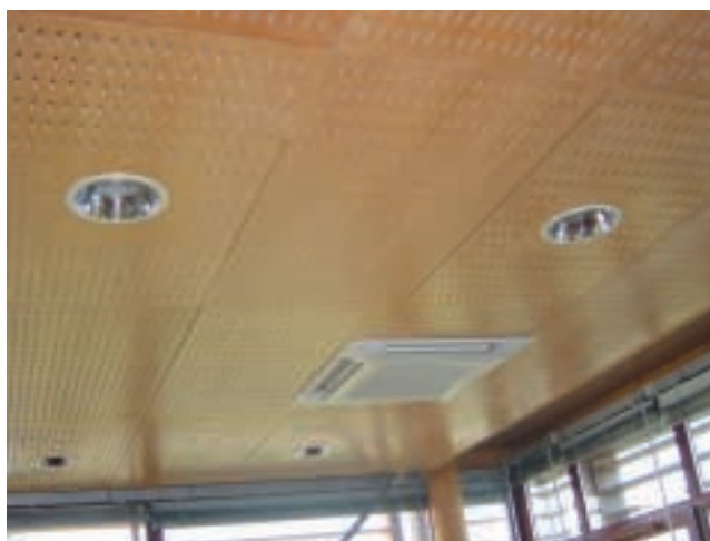
Figure 14 – Panneaux acoustiques

Les stratifiés décoratifs basse pression ( Low Pressure Laminates ) sont composés de deux ou trois couches de papier imprégné de résine mélamine assemblées entre elles sous l'action