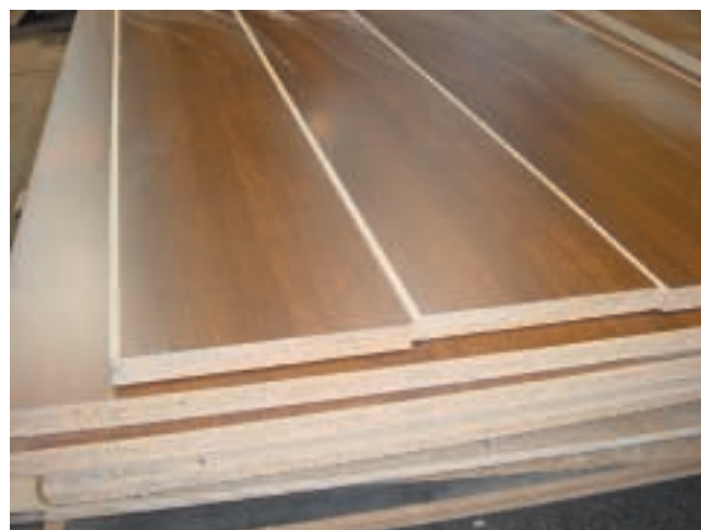
Figure 13 – Panneaux de particules stratifiés

L'application de placages bois sur des panneaux de faible qualité de surface est très fréquemment utilisée dans l'industrie de