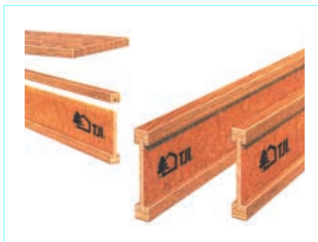
Figure 5 – Poutre en « I » TJI® constituée de deux membrures en lamibois et une âme en OSB

Généralement utilisé sous forme de poutre, le PSL est formé de lamelles longues et étroites assemblées parallèlement avec une