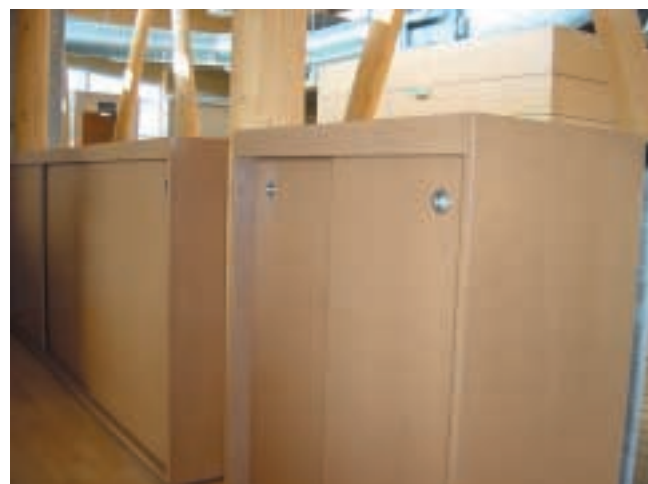
Figure 11 – Meubles en MDF

meuble, l'emballage, panneaux isolants (figure 10). Dans le second cas, on obtient les panneaux MDF, en fort développement depuis les années 1980. Ils sont usinables dans la masse et présentent une belle finesse de texture souvent mise en valeur par un vernis (figure 11).