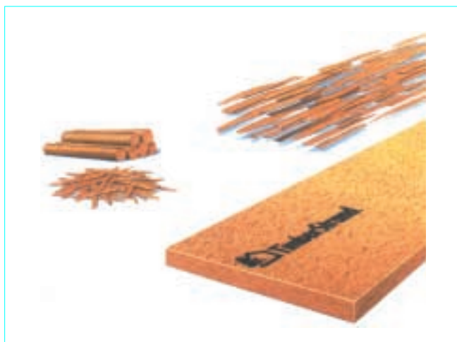
Figure 7 – Le TimberStrand™ LSL : dérivé de bois découpés en lamelles minces orientées (ou LSL : Laminated Strand Lumber )