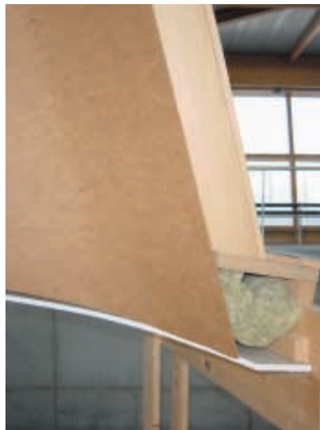
Figure 10 – Panneau de fibres dur mis en œuvre sur une ossature courbe

La norme NF EN 316 « Panneaux de fibres de bois – Définition, classification et symboles » définit ce matériau comme un matériau en plaque d'une épaisseur nominale égale ou supérieure à 1,5 mm obtenu à partir de fibres lignocellulosiques avec application de chaleur et/ou de pression. La cohésion provient soit du feutrage de ces fibres et de leurs propriétés adhésives intrinsèques, soit de l'addition aux fibres d'un liant synthétique. Dans le premier cas, on fabrique des produits essentiellement « techniques », actuellement en décroissance : panneaux minces pour fonds de