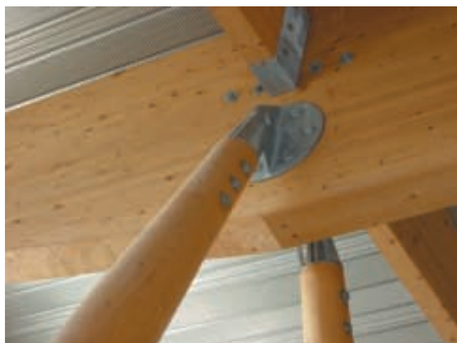
Figure 1 – Lamellé-collé

pression jusqu'à polymérisation et stabilisation de la colle. On peut obtenir des éléments droits ou courbes. Les sections sont généralement rectangulaires mais on peut disposer de poteaux profilés, permettant de réaliser des formes à 120°, 135° ou 150°, ou de poteaux ronds, tournés après collage sur une machine à commande numérique, et d'éléments de formes variables. Certains fabricants proposent des madriers de chalet en lamellé-collé.