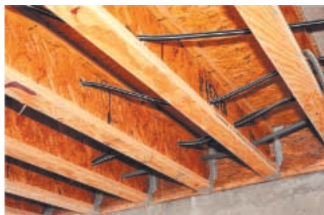
Figure 15 – Poutre en « I » TJI® mises en œuvre

Les produits utilisés pour la finition décorative de panneaux ignifuges (placages, stratifiés...) doivent répondre au même classement que les panneaux supports et il est nécessaire que l'ensemble revêtement plus support suive également les mêmes exigences. Le choix de la colle et les conditions de collage jouent donc un rôle important dans le maintien du classement de réaction au feu. La migration de sel ignifuge en surface peut nuire au collage. Les colles PRF (collage d'éléments structuraux), UF (collage de placages), vinyliques et « contact » peuvent être utilisées mais il est recommandé de consulter le fournisseur du matériau ignifugé et le fournisseur de colle.