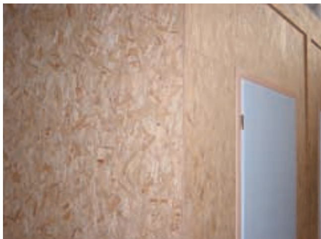
Figure 9 – OSB mis en œuvre