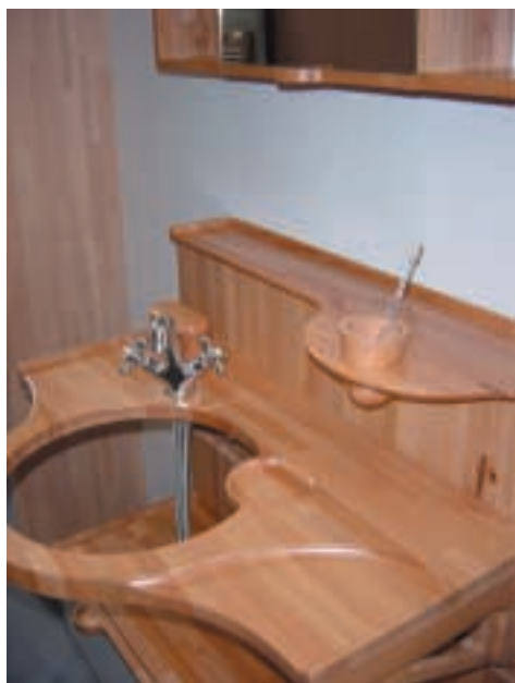
Figure 2 – Élément de salle de bain en bois panneauté

La qualification professionnelle nationale est attribuée par l'Organisme certificateur professionnel de qualification et de certification du bâtiment (Qualibat). Les qualifications Qualibat Charpente Bois lamellé-collé sont les suivantes :