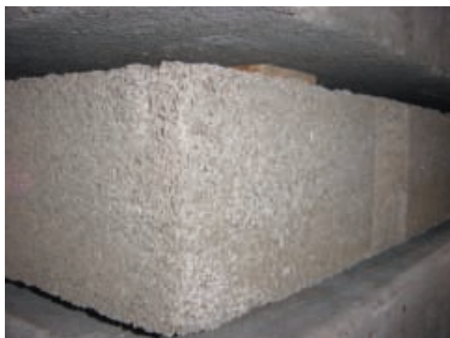
Figure 12 – Dalle en béton de bois