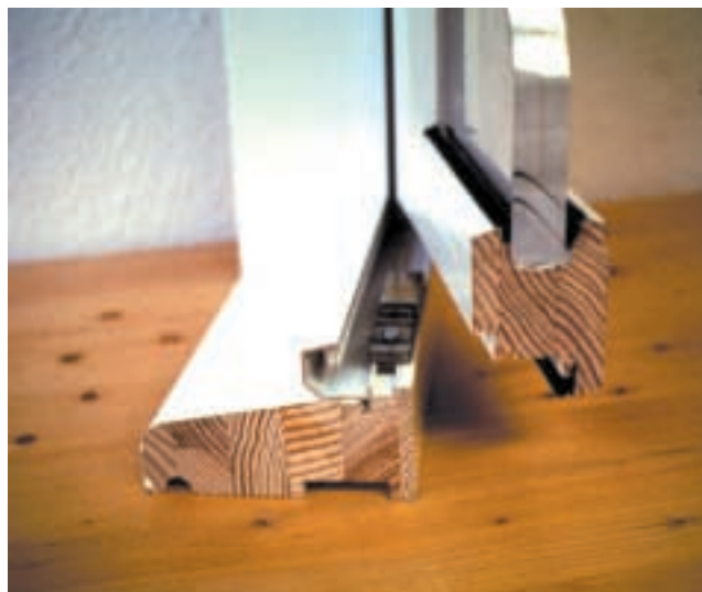
Figure 3 – Menuiserie en carrelat lamellé-collé abouté