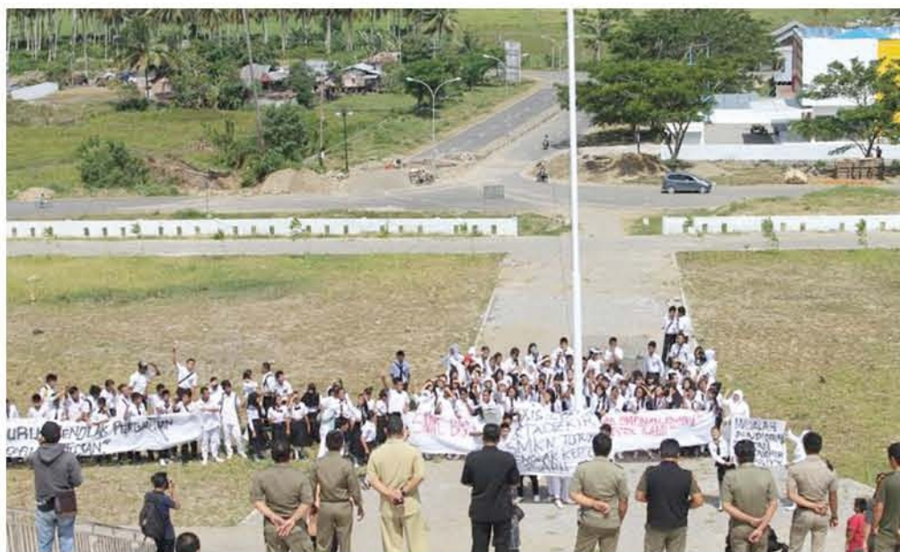
TOLAK KEPSEK - Kantor Bupati ramai oleh demonstrasi ratusan siswa Sekolah Menengah Kejuruan (SMK) Negeri 1 Tutuyan, Selasa (23/9). Para siswa menolak kepala sekolah yang baru dan menuntut kepala sekolah lama kembali bertugas di sekolah mereka.