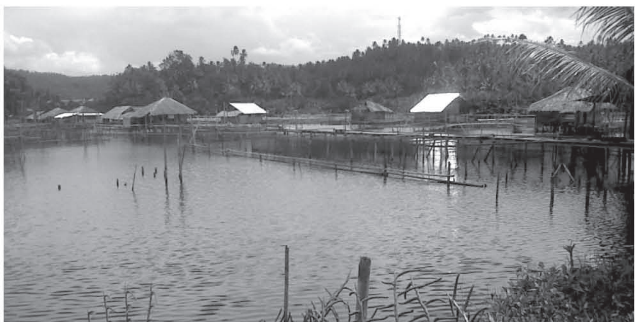
POTENSI - Danau Bulilin di Minahasa Tenggara dapat menjadi obyek wisata menarik jika mampu dikelola secara bagus layaknya Danau Linau di Tomohon.