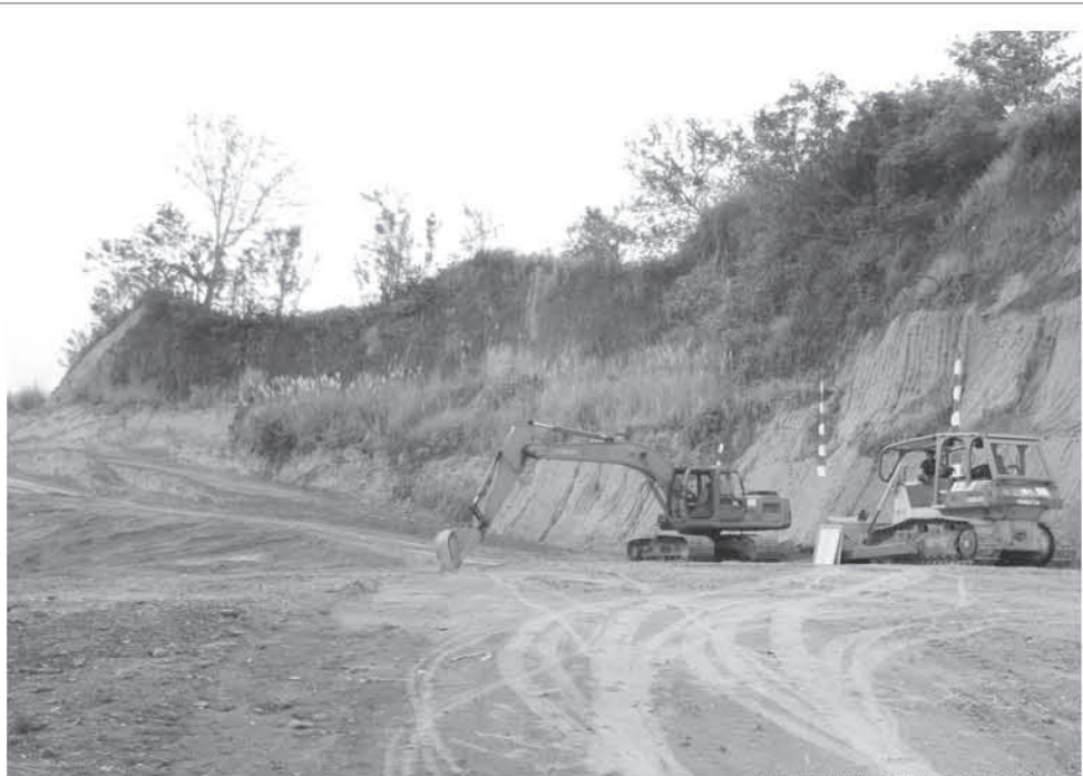
JALAN TOL - Alat berat meratakan tanah yang menjadi lokasi jalan tol di perbatasan Kabupaten Minahasa Utara dan Kota Manado, Senin (22/3).