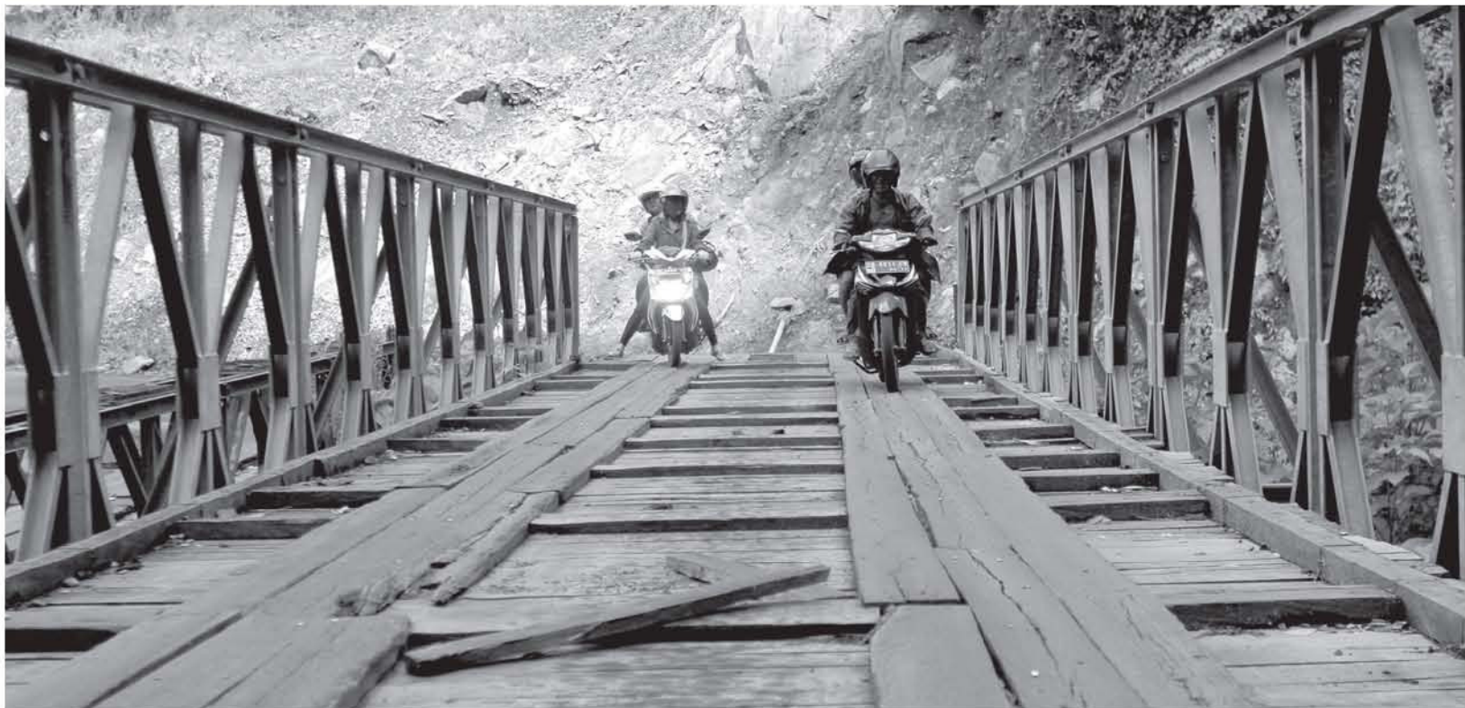
DARURAT - Kendaraan melintas di jembatan bailey di Tinoor, Kota Tomohon, Senin (22/9). Jembatan tersebut dibangun untuk mengganti jalan antara Manado dan Tomohon yang terputus akibat bencana longsor pada Januari lalu.