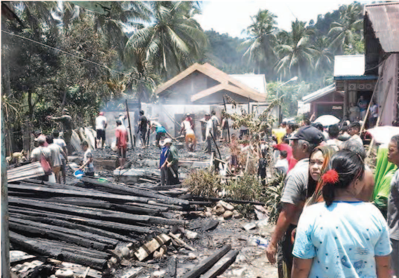
BERSERAKAN - Puing-puing berserakan dari sisa kebakaran rumah di Desa Lobong Lingkungan Tujuh Kecamatan Passi, Selasa (23/9).