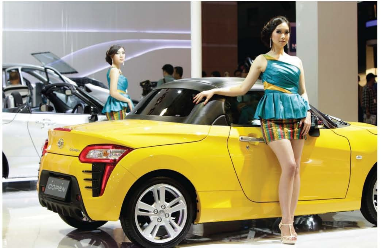
PAMERAN OTOMOTIF - Sales promotion girl (SPG) stan Daihatsu berpose di sela-sela pameran 22nd Indonesia International Motor Show (IIMS) 2014, di JIExpo, Kemayoran, Jakarta Pusat, Kamis (18/9). Pameran otomotif terbesar di Indonesia ini akan berlangsung hingga 28 September 2014.