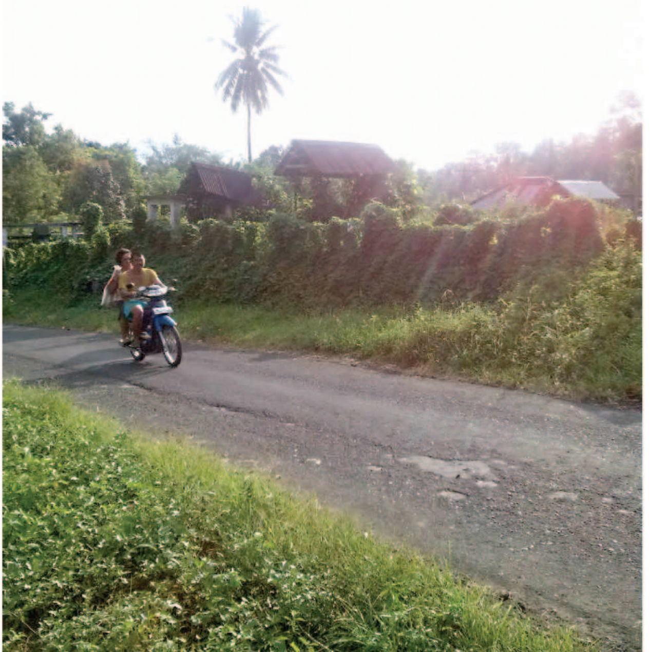
DILALUI PROYEK TOL - Lokasi pekuburan di Kawangkoan yang akan dipindahkan karena bakal dilalui proyek Jalan Tol Manado-Bitung, Selasa (23/9).

kui toilet ini hampir tidak layak karena benar tidak terawat. "Baru masuk saja terasa ingin langsung keluar atau tidak ingin masuk, tapi karena terpaksa maknyaman tidak mau atau suka tidak suka harus menggunakannya," terangnya. "Ia berharap pemerintah terkait yang mengelola toilet dapat memperhatikan perbaikan dan perawatan toilet sehingga tidak rusak atau terlihat jorok," pungkasnya menutup pemicaraan. (kel)