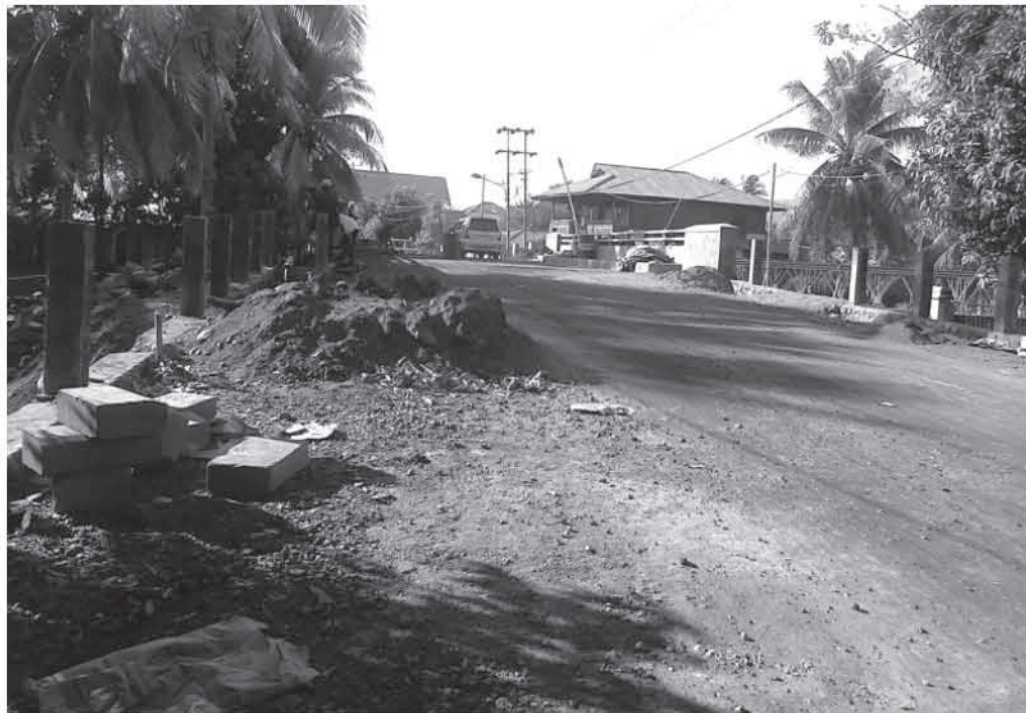
JEMBATAN MATANI - Mikrolet melintasi Jembatan Matani yang telah rampung proses perbaikannya, Selasa (23/9).