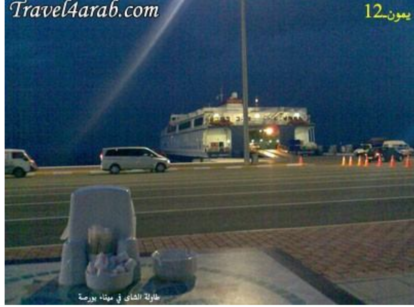
طاولة الشاي في ميناء بورصة