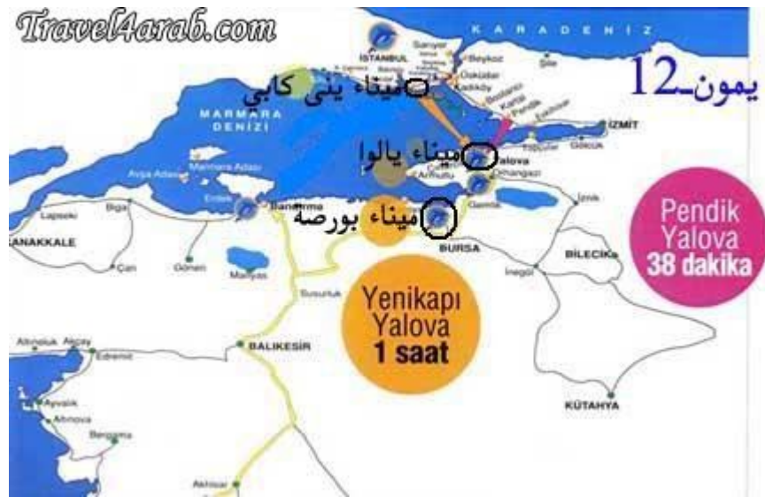
ميناء يالوفا ( يالوا )