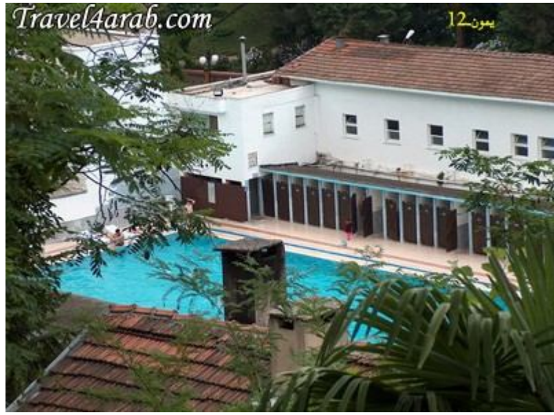
صور "ايسن كوى"