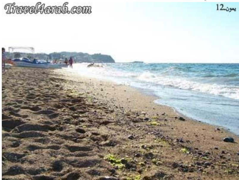
الفنادق والشقق موجودة في يالوا -- وترمال