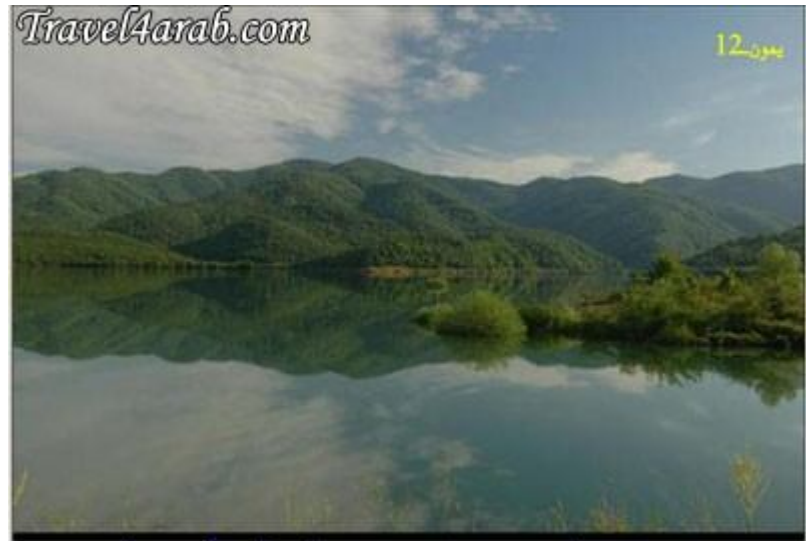
بحيرة في جوق جدرا ..... القريبة جداً من ترمال