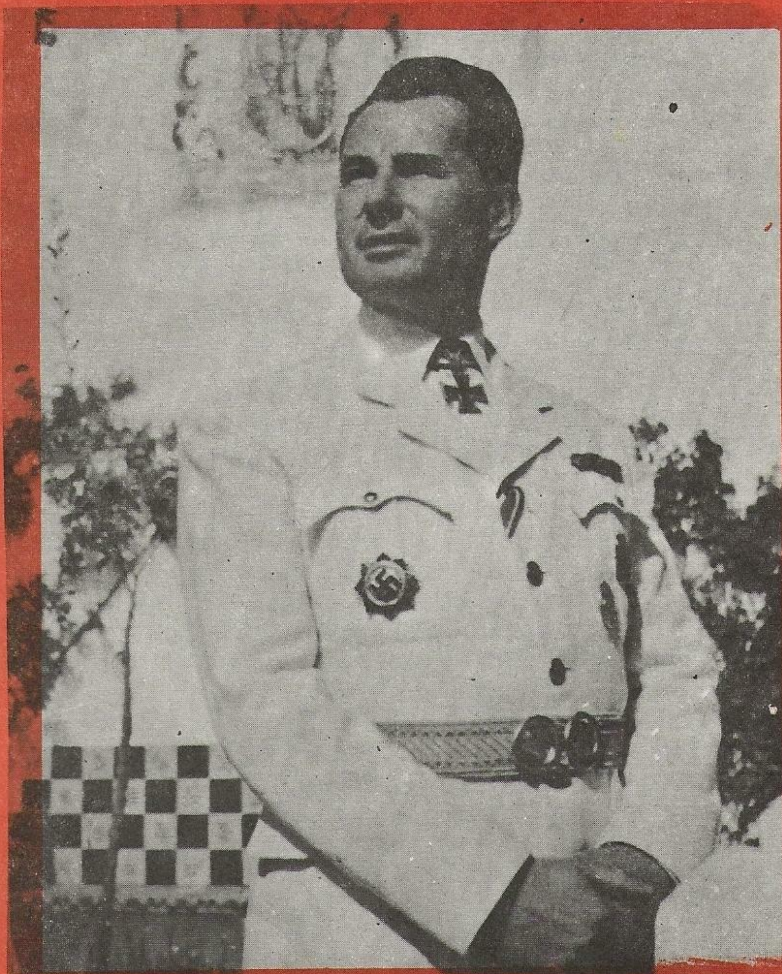
León Degrelle