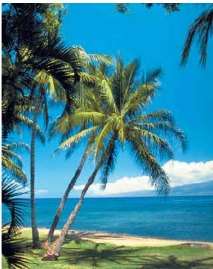
Ảnh: Maui beach

Con chim đại bàng khổng lồ (Boeing 747) nhẹ nhàng từ từ hạ cánh sau gần 5 giờ bay từ Phi trường Oakland đi Honolulu (9 giờ 30 đêm). Từ bên cánh trái dọc theo phi đạo nhìn xuyên qua cửa sổ nhỏ, tôi mục kích một đàn chim sất, màu xám xỉ trong tư thế gập gù, sẵn sàng cất cánh khi có bất cứ một biến động nào, vì đây là một phi trường quân sự (Hickam Air Force Base).