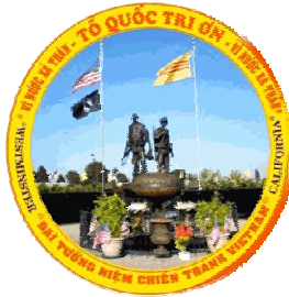
LOGO do HUY VÂN sáng tạo

Tôi nhìn Anh bằng hai dòng nước mắt Tôi phục Anh trong khí phách hiên ngang Tôi mến Anh qua nghĩa cử tiềm tàng Một người con chính thống Việt Nam.