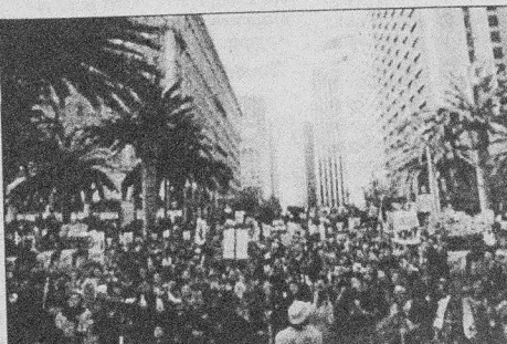
Διαδηλωτές στο Σαν Φραντζίσκο

Οι λαοί κινητοποιούνται και διαδηλώνουν ενάντια στα πολεμοχαρή σχέδια των ιμπεριαλιστών. Από την συγκέντρωση του 1,5 εκατομμυρίου Ιταλών στις 5 Οκτώβρη μέχρι το ένα εκατομμύριο της συγκέντρωσης στην Φλωρεντία στις 9 του Νοέμβρη και ενδιάμεσους σταθμούς διαδηλώσεις στην ίδια την Αμερική με εκατοντάδες χιλιάδες κόσμου από το Σαν Φραντζίσκο ως την Ουάσινγκτον, το Λονδίνο, την Αυστρία, την Ιαπωνία. Αλλά και τις χιλιάδες των διαδηλωτών της Ελλάδας στις 31 Οκτώβρη (Αθήνα, Θεσσαλονίκη, Πάτρα, Ηράκλειο, Βόλο, Γιάννενα, Χανιά, Καρό-τσα, Τρίκαλα, Καλαμάτα κ.α.) λένε ΟΧΙ στον πόλεμο του πετρελαίου. Οι διαδηλωτές στην Ελλάδα βροντοφώνα-ξαν φτάνοντας ως την αμερικανική πρεσβεία: ΟΧΙ στο σχεδιαζόμενο θρώμικο πόλεμο κατά του Ιράκ. ΟΧΙ στην εμπλοκή της Ελλάδας στον πόλεμο με οποιαδήποτε μορφή. ΟΧΙ στο φονικό εμπόργκο κατά