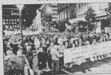
Από την συγκέντρωση κατά του πολέμου, στην Αθήνα

του Ιρακινού λαού. Λευτε-ρία στον παλαιστινιακό λαό. Ανεξάρτητο παλαιστι-νιακό κράτος με πρωτεύουσα την Ανατολική Ιερουσαλήμ.